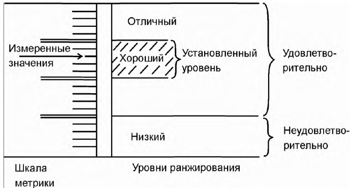
Схема 2 – Измеренное значение и установленный уровень

Количественные признаки могут быть измерены, используя метрики качества. Результат, т. е. измеренное значение, отображается в масштабе. Данное значение не показывает уровень удовлетворения требований. Для этой цели данные циклы должны быть разделены на диапазоны, соответствующие различным степеням удовлетворения требований (схема 2). Так как качество относится к конкретным потребностям, общие уровни ранжирования невозможны. Они должны определяться для каждого конкретного оценивания.